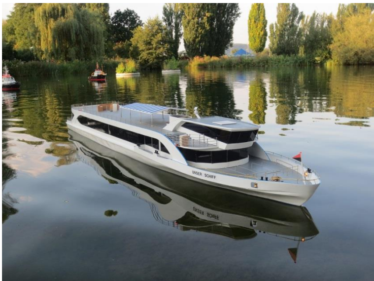
Das Schiffmodell „Unser Schiff“ anlässlich einer Testfahrt in der Grün80

Der eigentliche Schiffsneubau für das neue Basler Personenschiff, mit dem Projektnamen „Unser Schiff“, steht unmittelbar bevor und dauert rund eineinhalb Jahre. Die Inbetriebnahme des neuen Fahrgastschiffes ist im Frühjahr 2018 geplant. Um sich schon vorgängig ein genaues Bild vom Originalschiff machen zu können, hat die Basler Personenschiffahrt AG den renommierten Modellbauer Theo Maurer beauftragt, ein Modell des neuen Schiffes im Massstab 1:40 zu bauen. Theo Maurer hat bereits mehrjährige Erfahrung im Bereich Modellschiffsbau gesammelt und unter anderem für die Bielersee Schifffahrt drei Schiffe originalgetreu nachgebaut. Der Unterschied zum Projekt „Unser Schiff“ - und damit auch die Schwierigkeit und eigentliche Herausforderung - ist, dass hier noch kein reales Schiff existiert und alles lediglich aufgrund der Pläne konstruiert wurde. Der 66-jährige passionierte Modellbauer und gelernte Uhrenmacher, hat bereits über 1'200 Stunden in den Bau des 1,75 Meter langen Modells gesteckt und kann dies nun erstmals der Öffentlichkeit präsentieren.